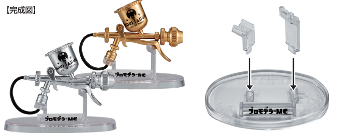
3 プロモテラー-MC 4 プロモテラー-RC