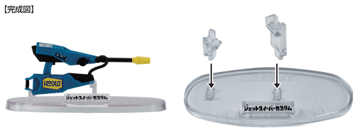
6 ジェットスイーパーカスタム