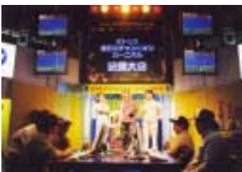
イベントでも大人気！