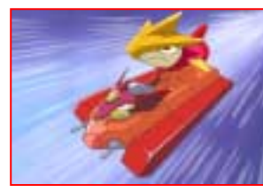
デュアルロゼ&キャリー