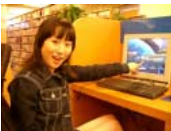
インターネットカフェでも 人気コンテンツに！