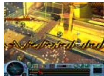
ダウンロードサイトで トップランク人気！