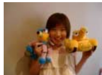
親しみやすいキャラクター