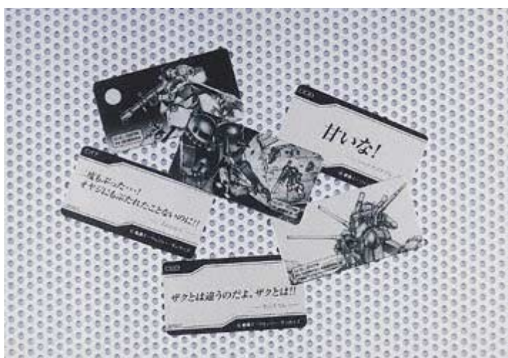
写真：『GUNDAM TAG - LET』アルミプレート 創通エージェンシー・サンライズ