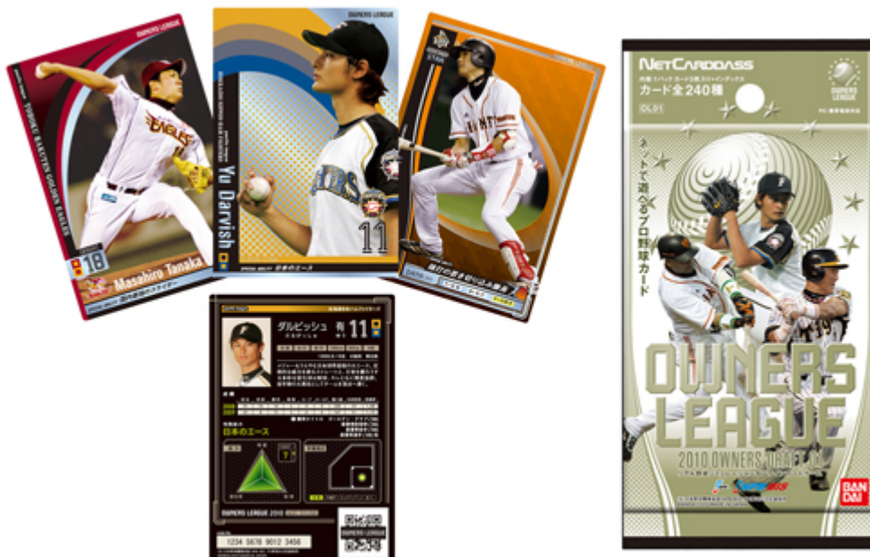
「プロ野球 オーナーズリーグ」(カード3枚1セット:315円・税込)

現在、「プロ野球 オーナーズリーグ」のβ版(パソコンのみ)を公開中です。公式サイトにアクセスすると、ランダムで25枚のデジタルカードが配布され、お試しでペナントレースに参加することができます。