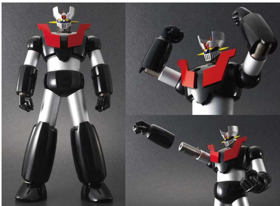
「ジャンボマシンダーNEO マジンガーZ」(26,250円/税込)

ターゲットは、40代の男性で、全国の模型店、玩具店、家電・量販店の模型・玩具売場、インターネット通販などで販売します。販売目標数は2011年3月末までに5,000個の予定です。