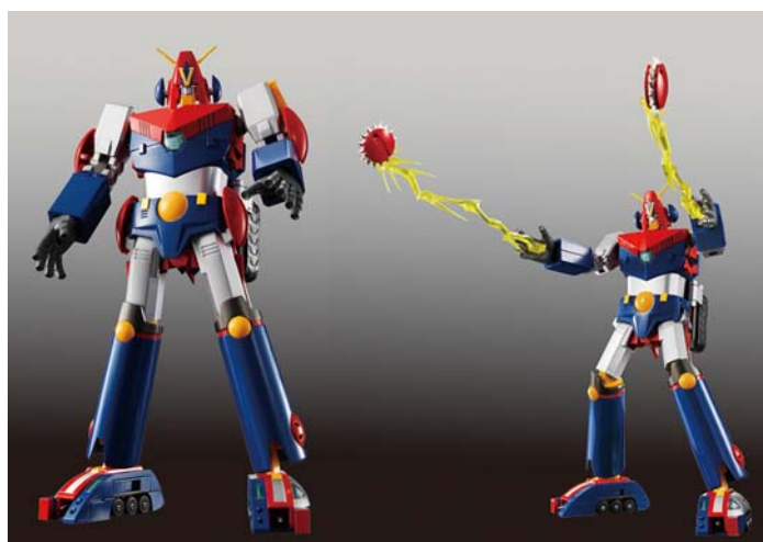
「超合金魂 GX-50 コン・バトラーV」(18,690円/税込)

ターゲットは、30～40代の男性で、全国の模型店、玩具店、家電・量販店の模型・玩具売場、インターネット通販などで販売します。販売目標数は2010年3月末までに2万個の予定です。