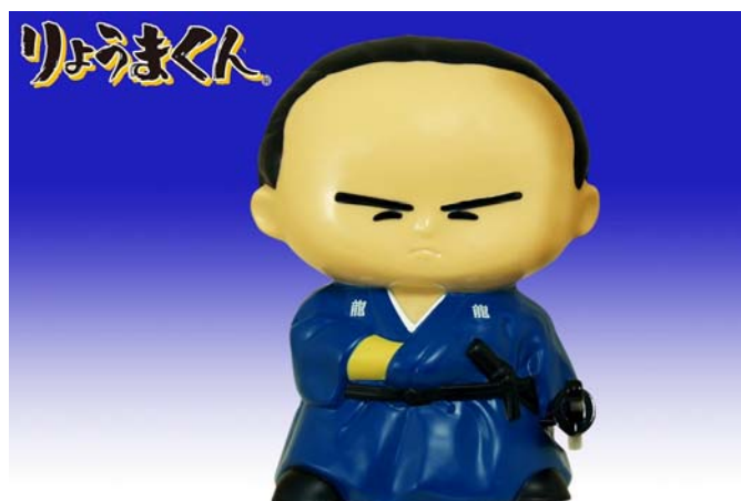
「りょうまくん」(1,365円/税込)

主な販売ルートは全国の雑貨店・百貨店・量販店の玩具売り場や玩具専門店などで、ターゲットは30代～50代の男性です。バンダイではこの『りょうまくん』を2010年12月末までに5万個を販売する計画です。