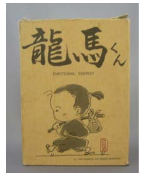
1985年に発売された初代「りょうまくん」