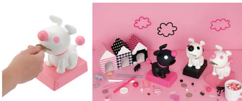
「モグモグ ワンコ」(全3種・各2,940円/税込)

主なターゲットは20代～30代の女性で、全国の雑貨店・百貨店・量販店の玩具売り場や玩具専門店などで販売します。バンダイはこの『モグモグ ワンコ』を2010年3月末までに5万個販売する計画です。