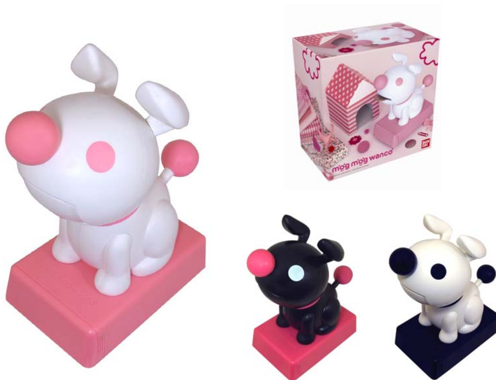
(左から)ホワイト&ピンク、ブラック&ピンク、ブラック&ホワイト

モグモグ ワンコホームページURL: http://www.asovision.com/wanco/