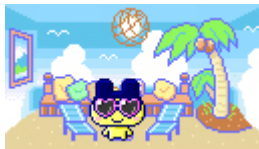
ダウンロードしたインテリアでリフォーム