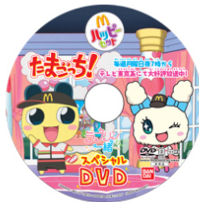
11月7、8日限定でプレゼントされる 「たまごっちスペシャルDVD」