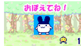
ミニゲームをどんどんダウンロード