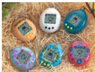
初代たまごっち(1996年発売)

たまごっちの誕生日で、『Tamagotchi iD』の発売日でもある 11 月 23 日(月)に、新旧たまごっち(※ちびたま除く)をキャンペーン実施店舗(※)までお持ちいただいた方に、感謝状とたまごギフト券をプレゼントします(※感謝状とたまごギフト券はなくなり次第終了とさせていただきます)。