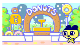
ドーナツこうえん