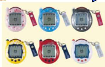
祝ケータイかいっすーたまごっちプラス(2004年発売)