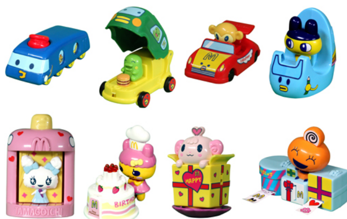
ハッピーセット「たまごっち」のおもちゃ全8種類 走ったり、音がでたり、音楽が流れるなど楽しい仕掛けがついています。

また、週末限定キャンペーンとして、11月7日(土)、8日(日)には、ハッピーセット1セット購入につき、特別なアニメーションや、たまごっち星のアイドル「ラブリン」が歌う大ヒット曲「エブリーラブリー」の映像や、キャラクター紹介、たまごっち絵描き歌、商品情報などが収録されたDVD1枚をもれなくプレゼントします。(※DVDは先着順につき無くなり次第終了です) DVDにはパスワードも収録されており、『Tamagotchi iD』に入力すると、『Tamagotchi iD』本体上でマクドナルドオリジナルのリビングにリフォームできたり、携帯サイト( http://tama-id.com/ )からアイテムやアクセサリをダウンロードすることができます。