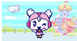
ダウンロードした衣装と背景で記念撮影