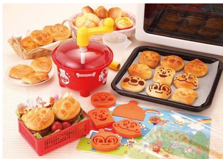
『パンがやけたよ！アンパンマン』(5,775円・税込)

販売ルートは玩具店、百貨店・量販店の玩具売場などです。バンダイではこの『パンがやけたよ！アンパンマン』を2010年3月末までに10万個販売する計画です。