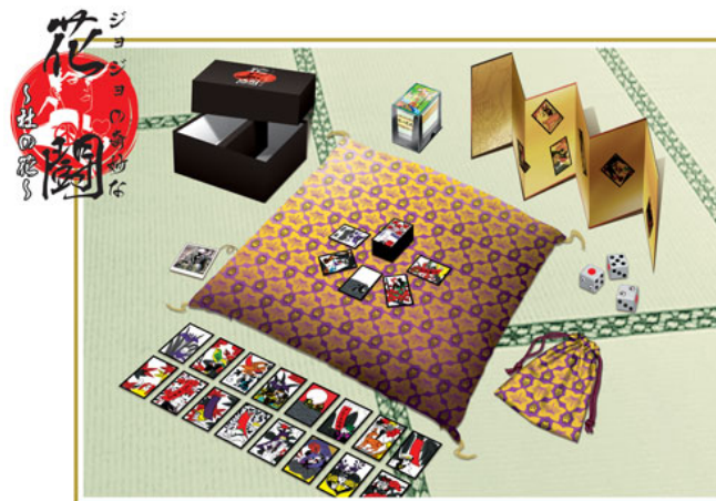
ジョジョの奇妙な花闘～杜の花～ (7,980円/税込)

2010年の年初めを、「ジョジョの奇妙な花 はな 闘 ばとる ～杜 もり の花 はな ～」で是非お楽しみください。