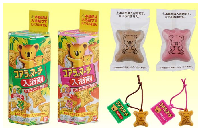
『コアラのマーチ入浴剤』 (全2種・各280円/税込)

主な販売ルートは、全国のドラッグストア、スーパーマーケット、量販店の日用品売り場、玩具店、コンビニエンスストアなどで、ターゲットは子どもから大人までの幅広い層です。バンダイではこの『コアラのマーチ入浴剤』を、2010年3月末までに30万個販売する計画です。