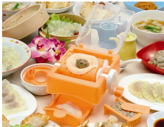
餃子メーカー くるりんパオ! (3,150円・税込)

料理に興味も持ち始めたお子様はもちろん、お弁当やホームパーティーにもぴったりのシリーズです。