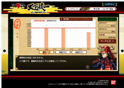
①歩数データ管理画面