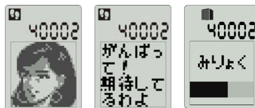
【応援キャラクター・魅力ゲージ例】

※目標通りにクリアしていくと、魅力ゲージが上がります。表示されるキャラクターが増えるほか、応援コメントももらえます。