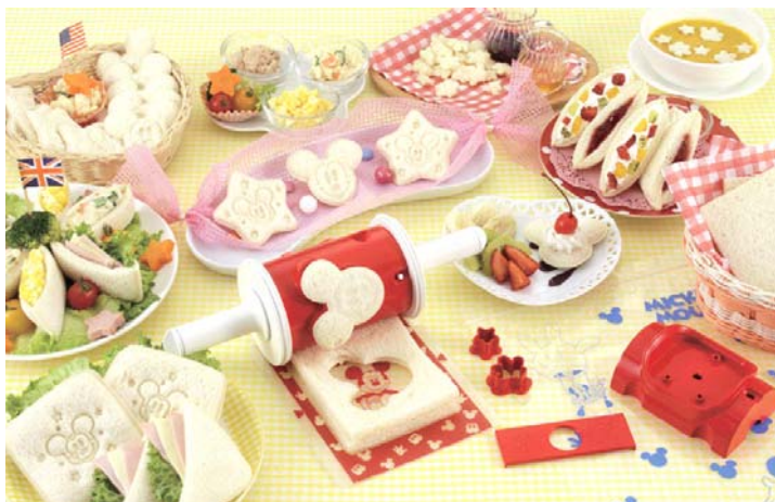
『パクンサンドメーカー ミッキーマウス』 (3,150円・税込)

春の新入園・新入学シーズンを迎え、お弁当デビューをされる親御さんや、行楽シーズン・朝食などにもぴったりの商品です。