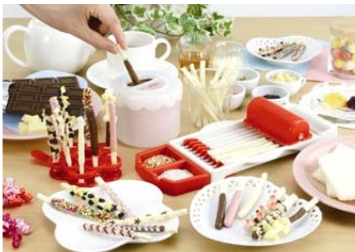
『パン デ スティックル』

バンダイが展開する調理玩具“クックジョイシリーズ”は、2007年7月に第1弾商品「のりまきまっきー」（2,940円／税込）を発売しました。以来、これまでに第6弾までを商品化し、シリーズ累計販売数が35万個を突破する人気商品となっています（2008年11月末現在）。親子でコミュニケーションしながら、楽しく簡単にお料理・食事ができる食育的な要素に加え、本体が丸洗いでコンパクトに収納できる等の使い勝手の良さが、幅広い層のお客様に支持されています。