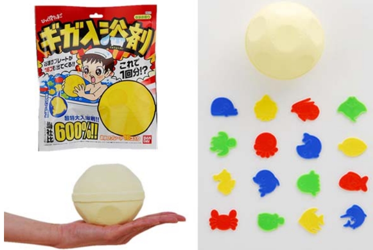
「ギガ入浴剤」 (オープン価格)

主な販売ルートは、全国の大型雑貨店・ドラッグストア・スーパーマーケット・量販店の日用品売り場、玩具店などです。ターゲットは、子どもから大人までの幅広い層です。バンダイではこの『ギガ入浴剤』を、2009年1月末までに5万個販売する計画です。