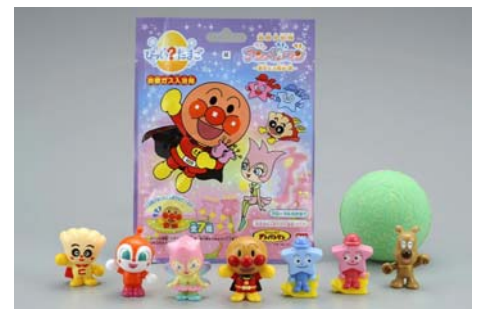
【びっくらたまご アンパンマン第11弾】

バンダイが2002年より販売している、炭酸ガス入浴剤「びっくらたまご」(315円/税込)は、入浴剤の中からキャラクターの人形が出てくる楽しさが人気となり、これまでにシリーズ累計3,000万個を販売しています。30種類以上のキャラクターを商品化、中でも「それいけ！アンパンマン」は11弾に至るなど、ベストセラー商品となっております。