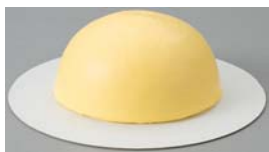
ドーム型のスポンジケーキに