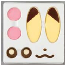
チョコレート製の目・鼻・口・耳・頬の パーツで装飾すると・・・