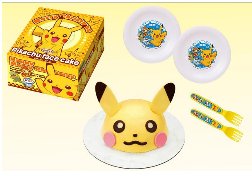
「ピカチュウフェイスケーキ」

販売ルートは、全国の量販店・コンビニエンスストア等です。メインターゲットは4歳～7歳の男女としており、クリスマスシーズン中に、15万個の販売を目標としています。