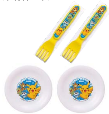
<同梱のフォーク・お皿>

■商品サイズ：パッケージ 約172mm(H)×175mm(W)×125mm(D)