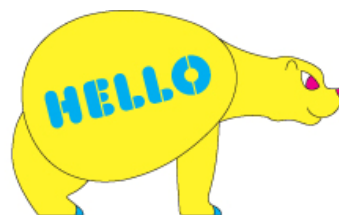
ベア<メッセージタイプ>