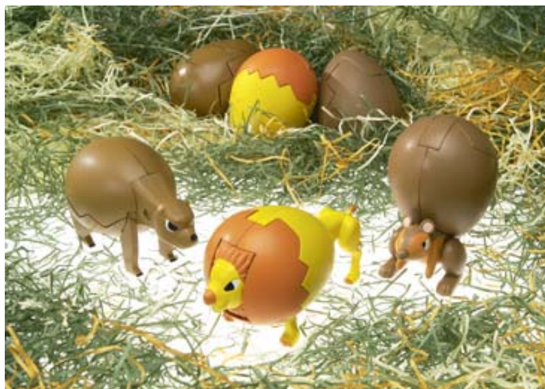
「タマゴラス クマ・ライオン・リス“プレーンタイプ”」(各 945 円/税込)

一般販売に先駆け、9月2日(火)～5日(金)まで東京ビッグサイトで行われる「第66回インターナショナルギフトショー」のバンダイブースにて展示します。