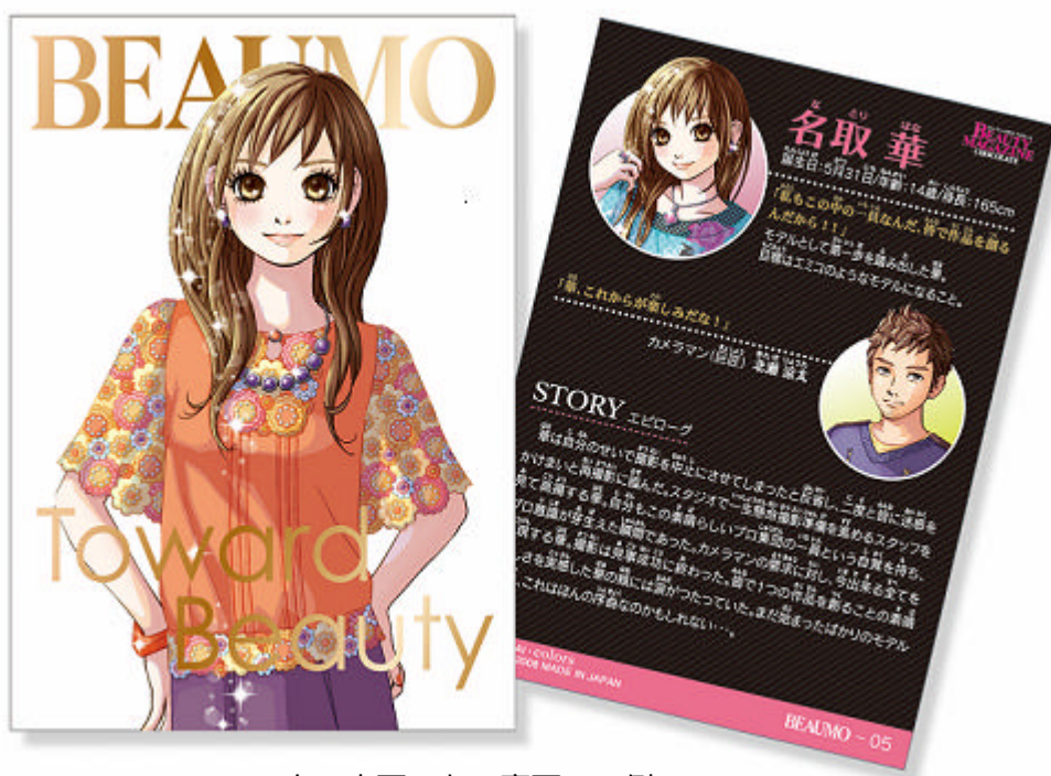
< 右：表面、左：裏面 一例 >

また、カードの裏面には、本ストーリーの世界観に加え、表面に描かれたイラストについてのファッションアドバイスを掲載。カードの種類は、箔押しカード4種、ノーマルカード8種、シルバーカード4種、ホログラムカード4種の全20種類で、全て集めると物語と1冊のファッション雑誌が完成します。