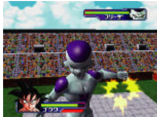
天下第一武道会モード