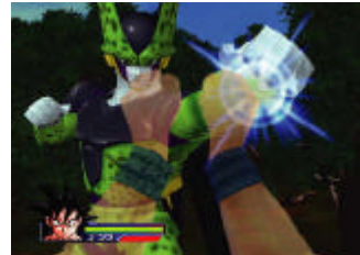
前作より大幅にグラフィックが向上

(C)バードスタジオ/集英社・東映アニメーション (C)BANDAI 2007 (C) 2007 KOTO Co.,Ltd