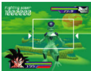
スカウターで戦闘能力を計れる