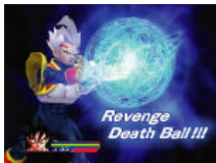
迫力の必殺技シーン