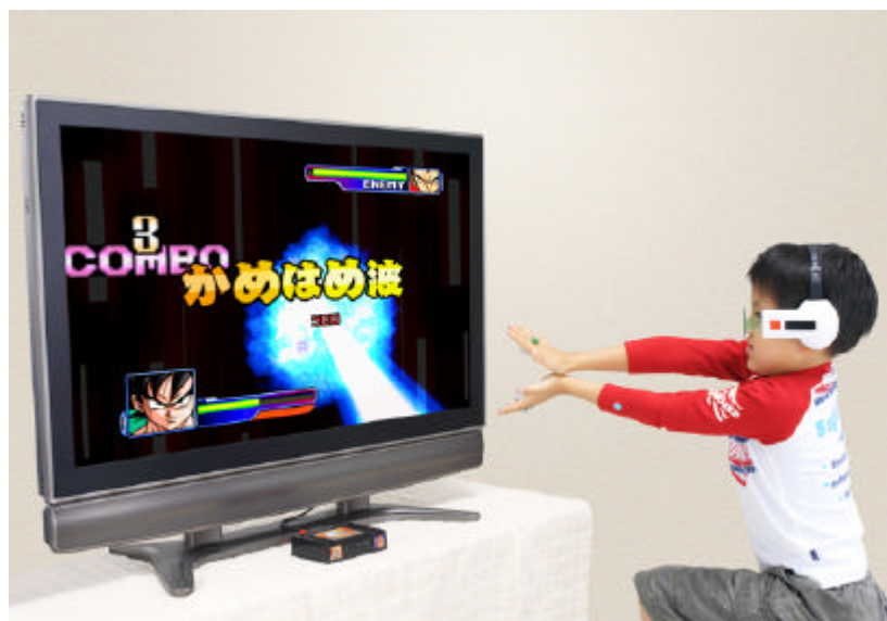
「ドラゴンボールZ スカウターバトル体感かめはめ波 ~ おらとおめえとスカウター」

主なターゲットは小学生男児で、販売ルートは全国の玩具店、百貨店・量販店の玩具売場です。この商品の販売目標は10万個です(2008年3月末まで)。