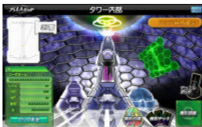
専用ウェブサイトの対戦タワー

この「デュエルポッド」の発売により、使用できるモンスターが増え、更なる熱戦が繰り上げられます。これは、玩具とオンラインゲームの融合による、新しい遊びの提案です。