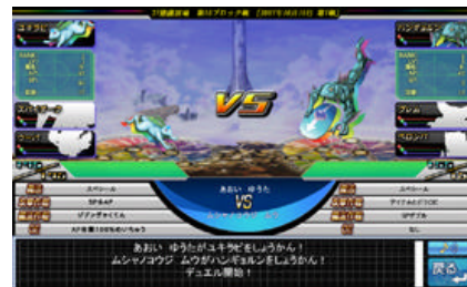
迫力の召喚モンスターバトル