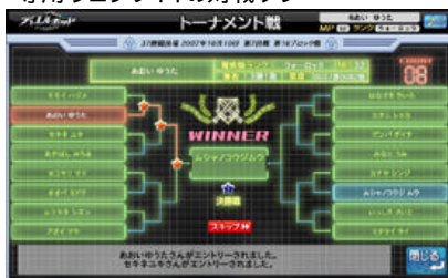
全国の対戦相手とのトーナメント表