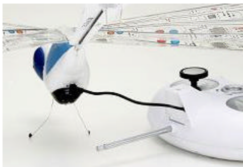
< 簡単な充電方法 >

「メカトンボ」本体には高性能小型充電式電池が内蔵されており、約25分の充電で約6分の連続飛行が可能です。充電は、本体をコントローラー（単3×6本別売り）を装着）につなぐだけなので、屋外でも簡単に充電ができます。また、はばたきの速さ、旋回角度の微調整がコントローラーで簡単に操作できる「デジタルプロポーショナル方式」を採用。トンボの脚の部分が受信アンテナになっており、スイッチオンすることで目がブルーに点灯し、飛行中には迫力のはばたき音をたてるなど、メカニクな要素も盛り込んでいます。