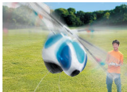
< 写真:『メカトンボ』 >