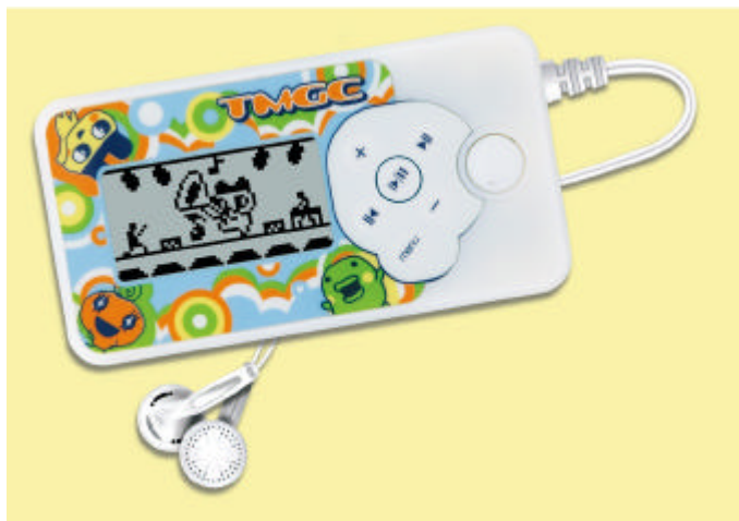
写真：「たまごっちミュージックフィーバー」(7,140円・税込)

主なターゲットは小学生の女兒で、販売ルートは、玩具店、百貨店・量販店の玩具売場などで、バンダイではこの「たまごっちミュージックフィーバー」を、2007年3月末までに5万個販売する計画です。