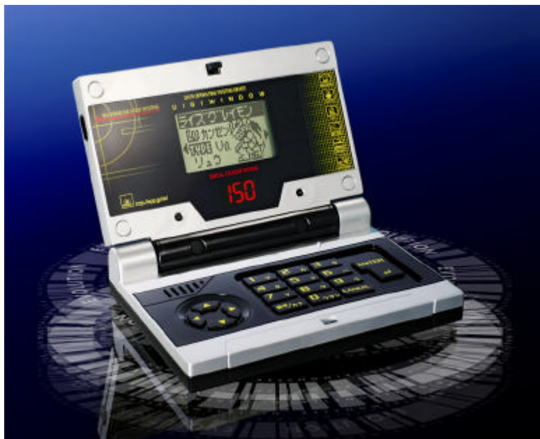
「デジウインドウ」(5,775円/税込)

主なターゲットは小～中学生の男子で、商品の販売目標数は2007年3月末までに5万個の予定です。