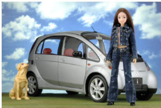
写真：桜奈 (Sakurana) 1st.」と桜奈専用の三菱自動車 [(アイ)] (1/6スケール 非売品)

バンダイでは 桜奈』を「バンダイアパレルの所属モデル」と位置づけ、着せ替え人形としての 桜奈』の販売はもちろん、桜奈』の過ごす世界の「衣」「食」「住」をファッションナブルに表現したジオラマの展示や、1/1サイズのアパレルの販売などを通して、20～30代の女性が思わず共感できるおしゃれなライフスタイルの形を提案していきます。なお、他企業や他ブランドとのコラボレーションも推進しており、すでに三菱自動車の軽自動車 [(アイ)]とのコラボレーションが決定しています(詳細は3P参照)。