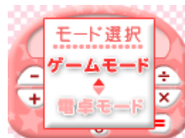
「遊んで デンタック」