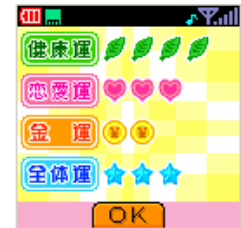
「つなげてカラーピクチャー」 「フォーチュンロット占い」

キッズ専用サービスでさらに楽しく *別途「キッズスタジオ」(詳細は4ページ)への加入が必要です